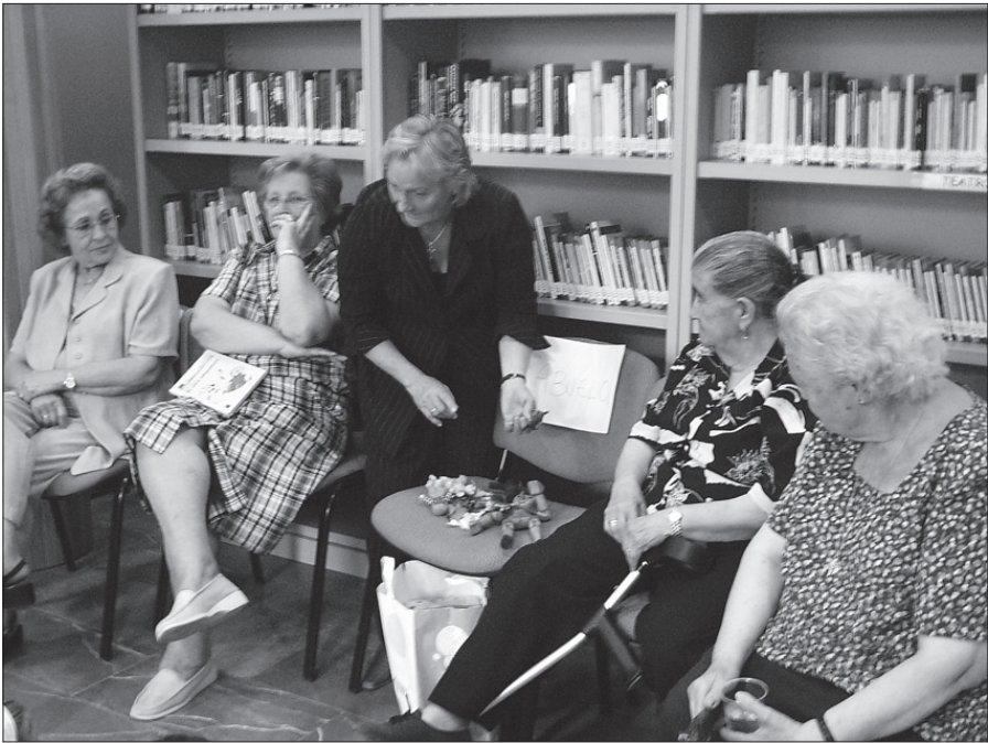
Abuelas y un abuelo participantes en los cuentacuentos de la Biblioteca Pública de Palomares del Río (Sevilla).